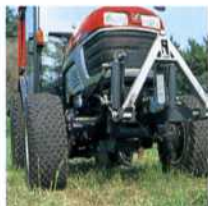
Front aftakas met fronthefinrichting