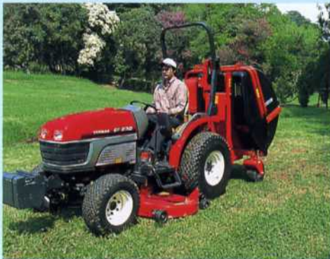
Middenondermaaiër Zwischenachsmäher mit Grassaufnahmesystem