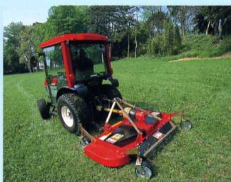
Cirkelmaaiër 3 punt achter Mulcher 3punkt Heckanbau