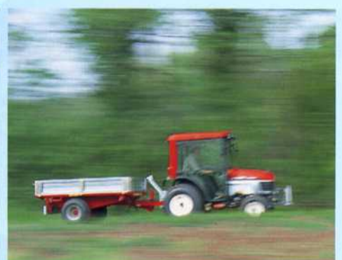
Aanhangwägen kieper Anhänger kippend