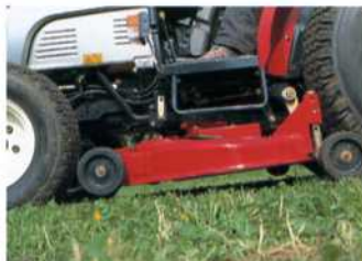
Frontzapfwelle und Fronthydraulik

Bodemvrijheid 15 cm hierdoor middenondermaaier eenvoudig te monteren en te demonteren